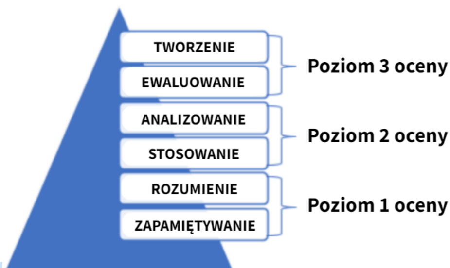
Związek między taksonomią Blooma a poziomami ramowymi

Aby opracować ramy dostosowane do różnych poziomów kompetencji, zastosowano taksonomię Blooma. Taksonomia kategoryzuje cele uczenia się w hierarchię, z najniższym poziomem skupiającym się na zapamiętywaniu i zdobywaniu wiedzy. W miarę wspinania się po piramidzie, cele stają się coraz bardziej złożone, obejmując zrozumienie, zastosowanie, analizę, ocenę i tworzenie. W przypadku ram kompetencji obywatelskich do każdego poziomu przypisano dwie kategorie z taksonomii Blooma, tworząc trzypoziomową strukturę oceny.